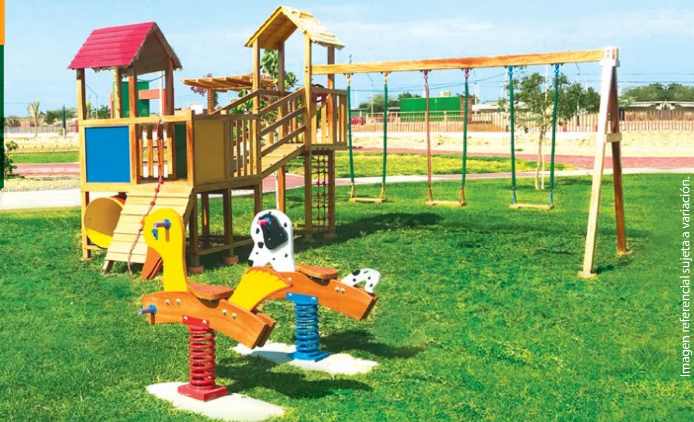
Imagen referencial sujeta a variación.