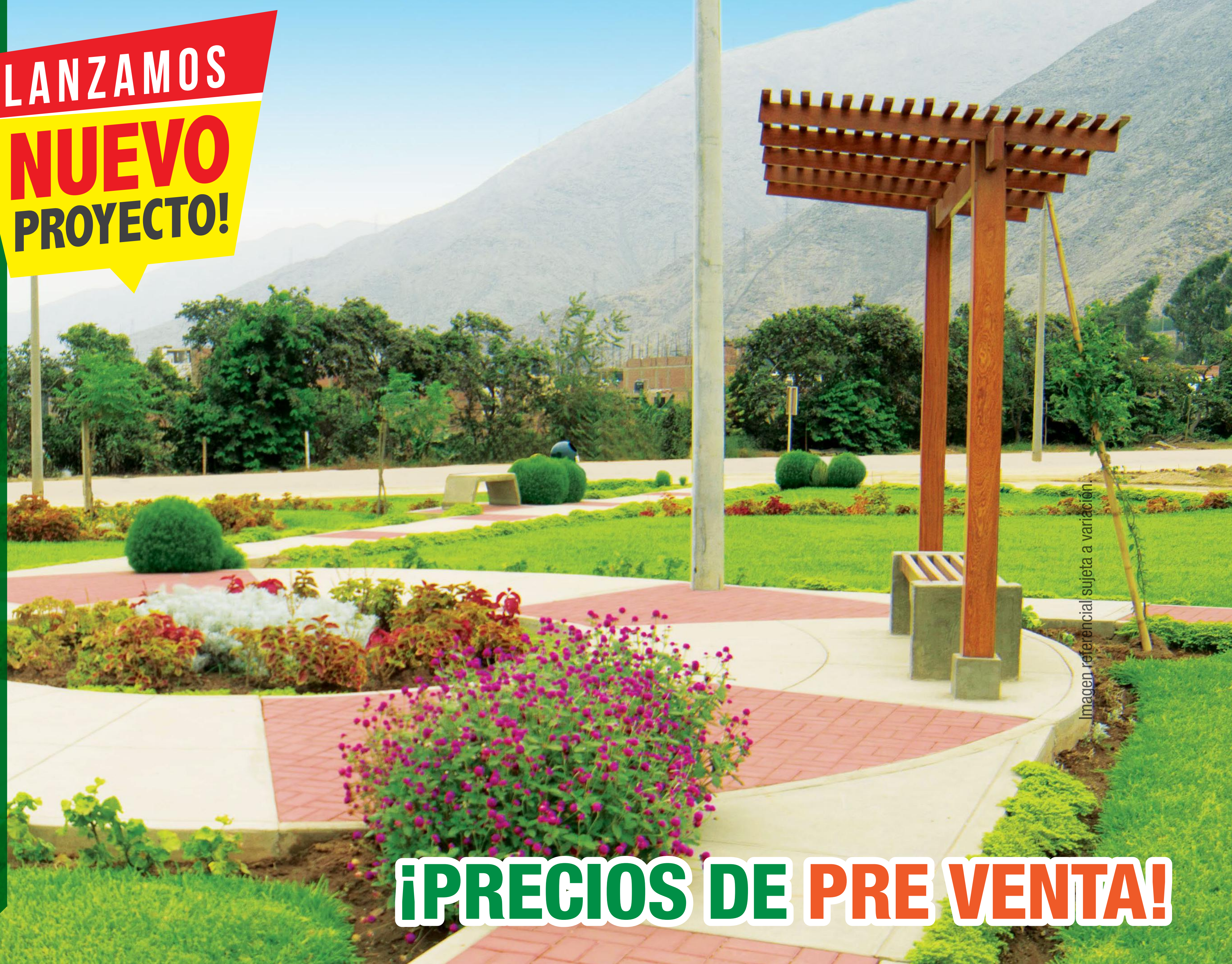
Imagen referencial sujeta a variación.