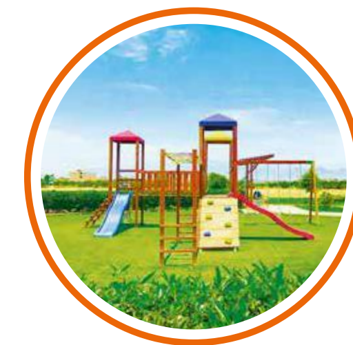
02 JUEGOS PARA NIÑOS