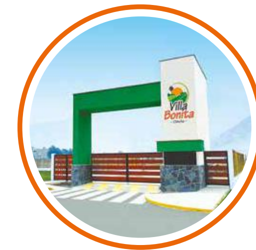
01 PÓRTICO DE INGRESO