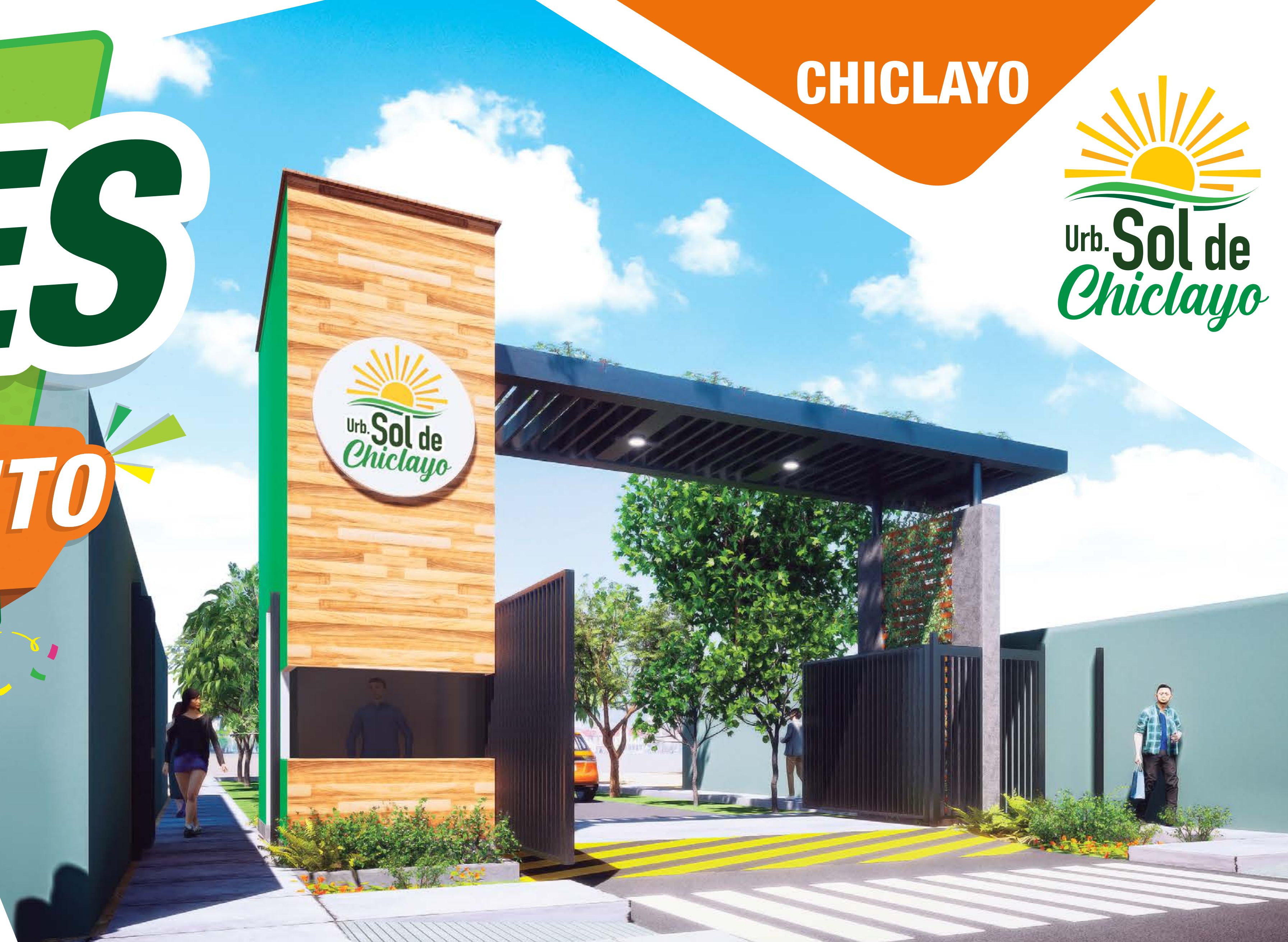
Imagen referencial sujeta a variación.