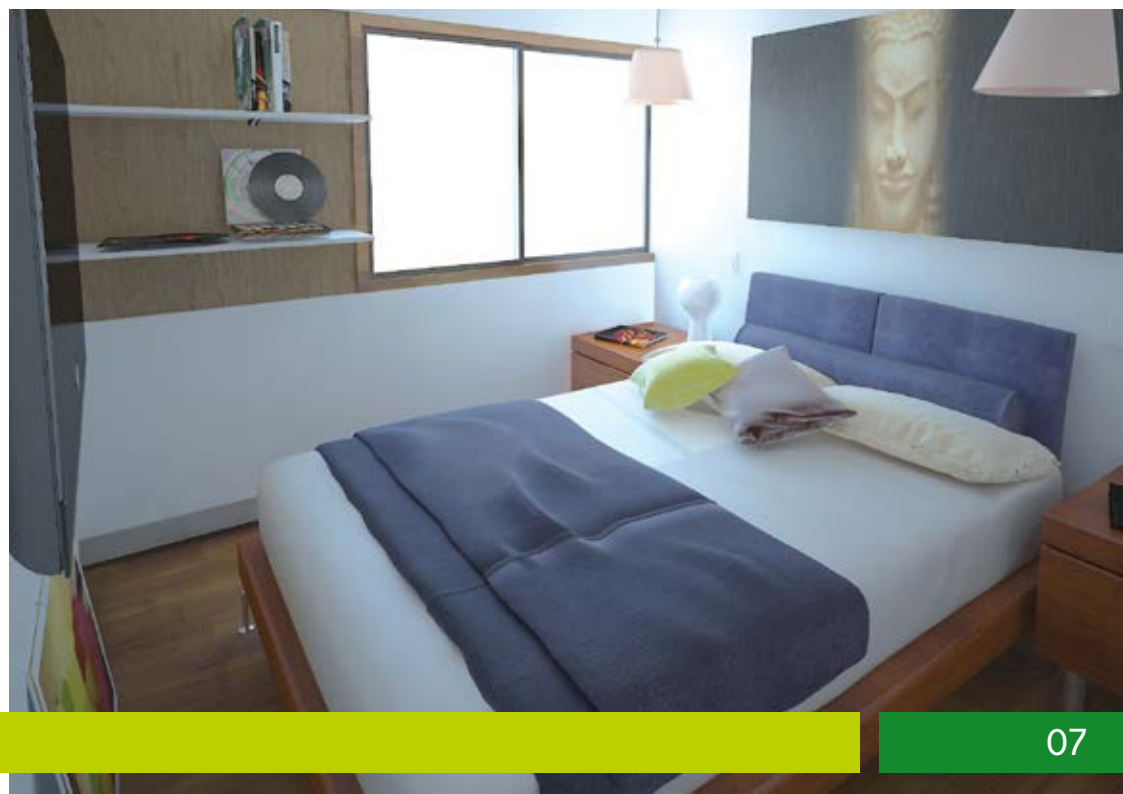
Imágenes referenciales sujetas a variación.